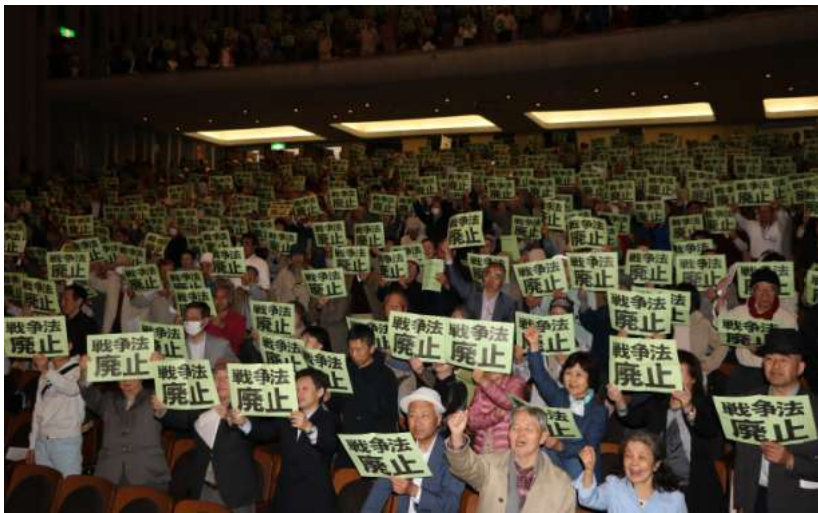
戦争法廃止を誓い合った集い=10日、新潟市

発行所 新いりがた 長岡市曲新町1-12-14 ☎025(247)6366 毎月第4日曜日 定価150円(送料50円)1966年7月22日 第三種郵便物認可