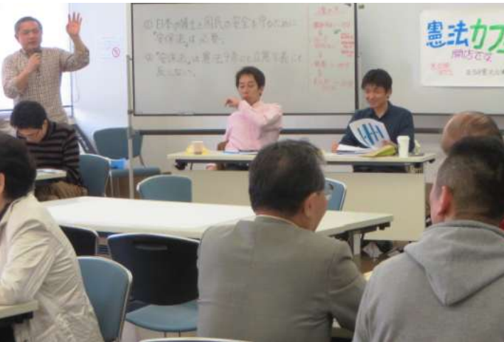
活発に議論した憲法カフェスペシャル

新潟市で3日、「憲法カフェ・スペシャル」が開かれ、28人が参加しました。県憲法会議 が3年前から取り組んできた憲法カフェ・10回記念として民主青年同盟県委員会との共催