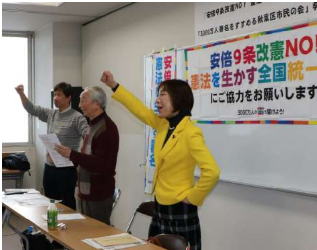
2万署名実現の決意を示した集会=21日、新潟市秋葉区

菊田議員は「市民と野党が力を合わせれば安倍一強を倒せる道筋」と述べました。自由党の森ゆうこ参