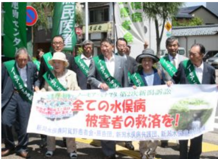
弁論、追加提訴で地裁に向かう原告・弁護団＝新潟市

新潟水俣病の未認定患者らでつくる新潟水俣病阿賀野患者会の22人が、国と加害企業の昭和電工を相手取り、損害賠償を求めた「1モア・ミナマタ第2次新潟全被害者救済訴訟」(昨年12月提訴)で5月28日、新潟地裁で第1回口頭弁論が行われました。同日、新たに10人が追加提訴しました。