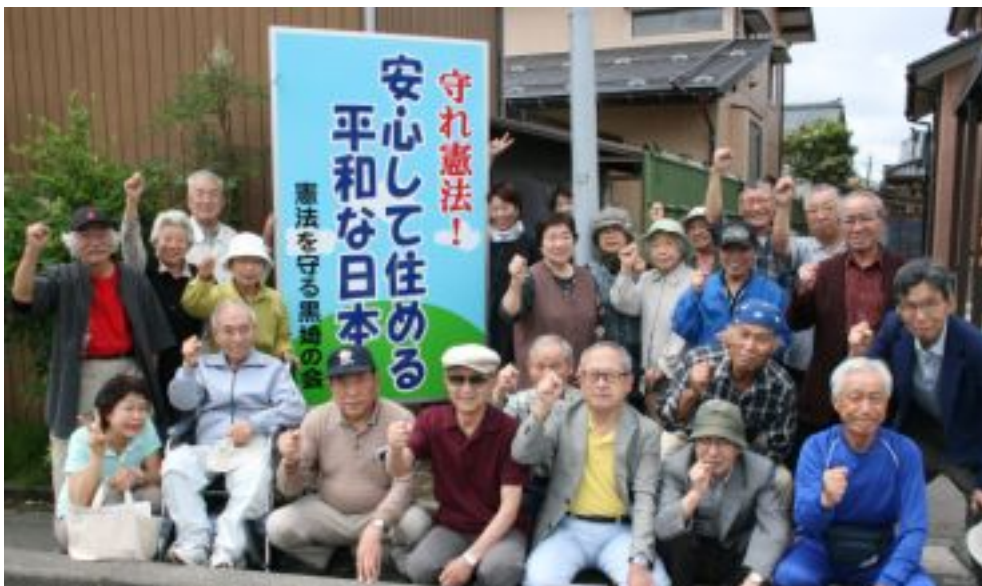
集団的自衛権行使容認反対、憲法を守る決意を固めあった黒埼の会の人たち=14日、新潟市

新潟市西区の「憲法を守る黒埼の会」は、看板を設置し、14日に24人が参加して「喜びある」目立つ場所で、会員の