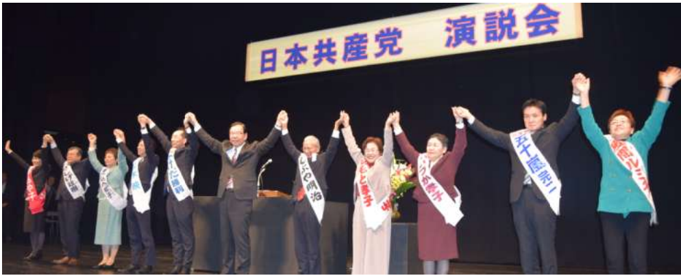
声援に応える志位委員長と各候補=8日、新潟市