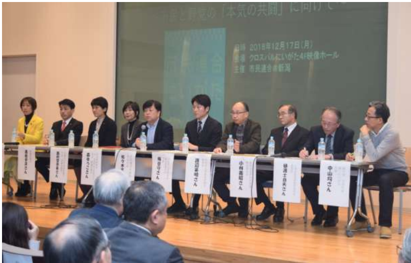
野党候補一本化、本気の共闘にむけ確認しあったフォーラム＝17日、新潟市

新潟市で17日夜、市民連合@新潟が、野党7党の各県連代表と県内選出の国会議員を招いて「第1回市民公開フォーラム」を開き、野党各党は、来年7月の参院選・新潟選挙区(定数1)の候補の一本化をめざすことを確認しました。