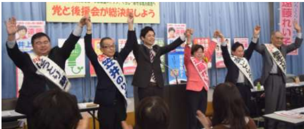
武田議員 中央と各候補 長岡市